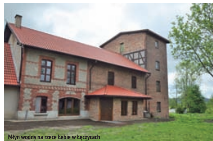
Młyn wodny na rzece Łebye w Łęczycach