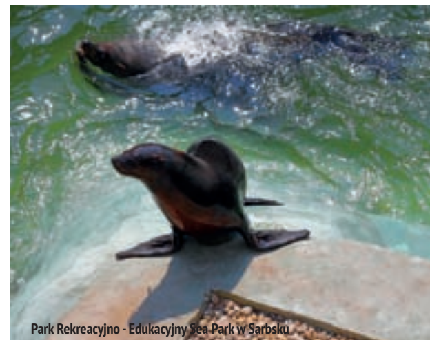
Park Rekreacyjno - Edukacyjny Sea Park w Sarbsku