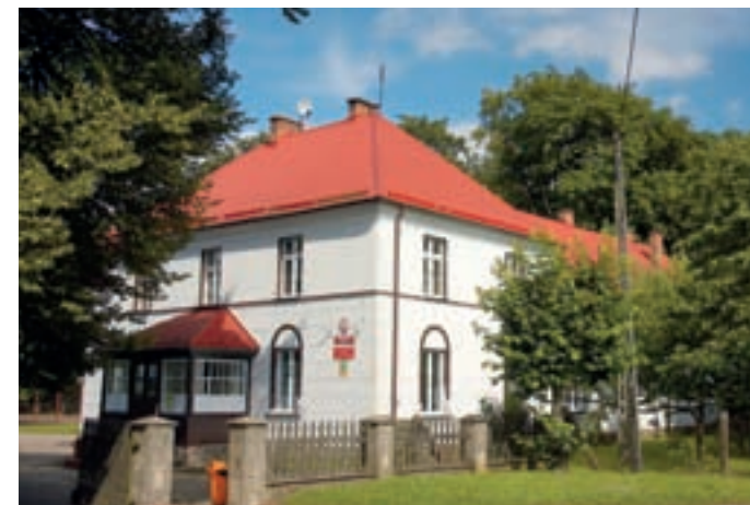
Dwór z 1880 roku i park w Cewicach.

Kościół p.w. Michała Archanioła został zbudowany w 1870 roku. Usytuowany jest na niewielkim wzniesieniu, na którym odkryto wcześniej cmentarzysko ludności pomorskiej z wczesnej epoki żelaza z grobami skrzynkowymi. Jest to budowla orientowana, zbudowana z cegły licówki. Świątynia ma prezbiteriałną, pięcioboczną absydę, dwie przybudówki po obu stronach oraz wieżę z portalem głównego wejścia od zachodu. W wieży zawieszono trzy dzwony metalowe, odlane w 1870 roku w stalowni w Bochum. Wystrój wnętrza ma charakter typowy dla zborów ewangelickich.