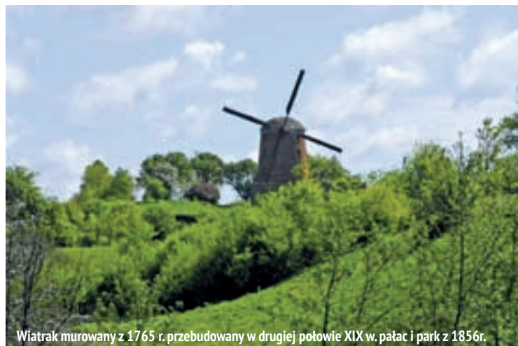
Wiatrak murowany z 1765 r. przebudowany w drugiej połowie XIX w. pałac i park z 1856r.

Jest przybrzeżnym zbiornikiem położonym ok. 1 km od morza. Posiada dość muliste dno i porośnięte trzciną brzegi. Jego powierzchnia wynosi 651,7 ha. Głębokość maksymalna 3,2 m, ale w wielu miejscach poziom wody ma tylko jeden metr. Ta niewielka głębokość i duża powierzchnia sprawia, że jest to doskonałe miejsce do nauki windsurfingu. Szkoły znajdują się m.in. w Nowęcinie, Żarnowcu. Wokół jeziora biegnie malownicza trasa rowerowa o długości 31 km. Ponadto przez jezioro przepływa rzeka Chelst, która wpada do pobliskiej rzeki Łeby. Dzięki czemu tworzy się ciekawa trasa kajakowa. Kajaki można wypożyczyć w Łebie w wielu punktach rzeki Chelst, oraz w ośrodkach wypoczynkowych, zwłaszcza położonych w pobliżu jeziora Sarbsko.