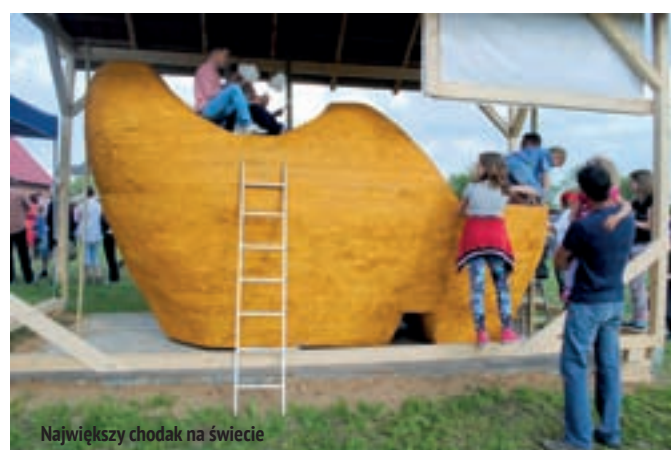
Największy chodak na świecie