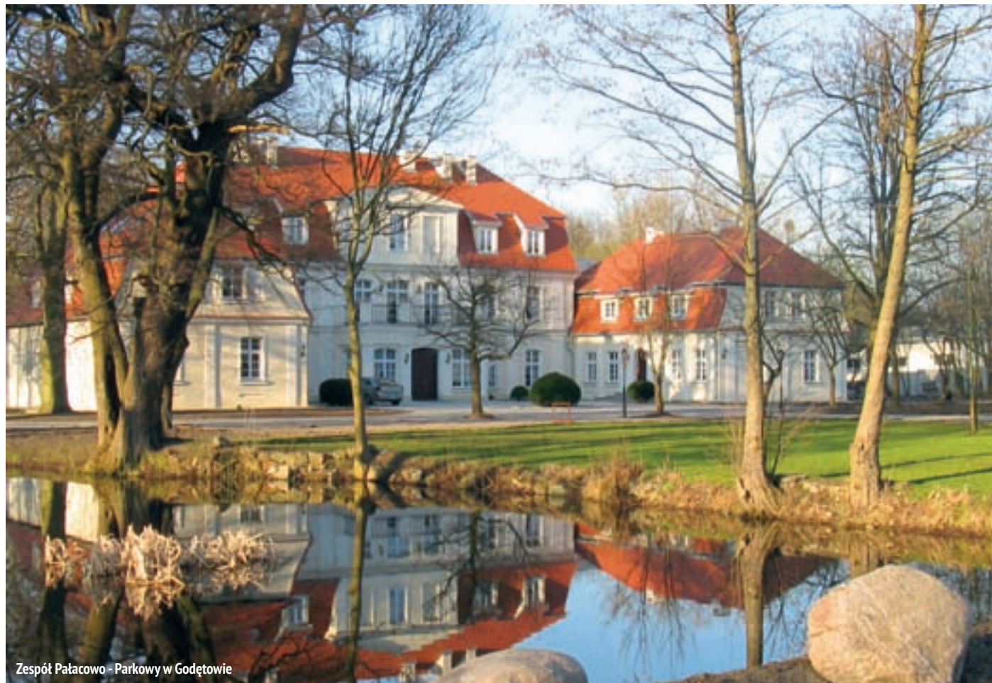
Zespół Pałacowo - Parkowy w Godętowie