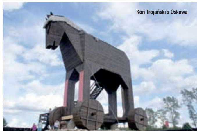
Koń Trojański z Oskowa