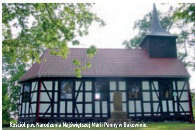
Kościół p.w. Narodzenia Najświętszej Marii Panny w Bukowinie.