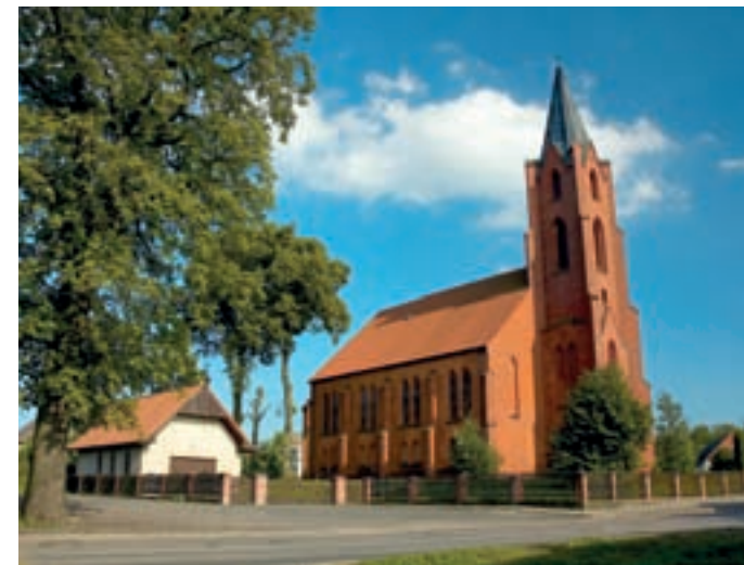
Kościół p.w. Michała Archanioła w Łebuni.

Przez teren gminy przepływają cztery rzeki: Bukowina, Okalica, Struga Krępkowicka oraz Unieszynka. Na obszarze gminy położonych jest 18 jezior. Największe z nich to: Brody, Oskowo, Osowskie oraz Święte. Jezioro Święte ma unikatową wartość przyrodniczą - jest jednym ze 160 istniejących w Polsce jezior lobeliowych. W wodach rzek, strumieni i jezior żyją liczne gatunki ryb: karaś, kleń, leszcz, lipień, płoć, sandacz, stynka, szczupak, śliz.