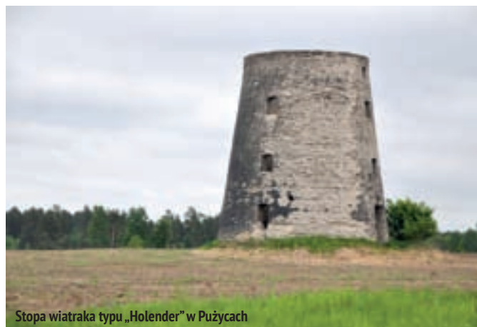
Stopa wiatraka typu „Holender” w Pużycach